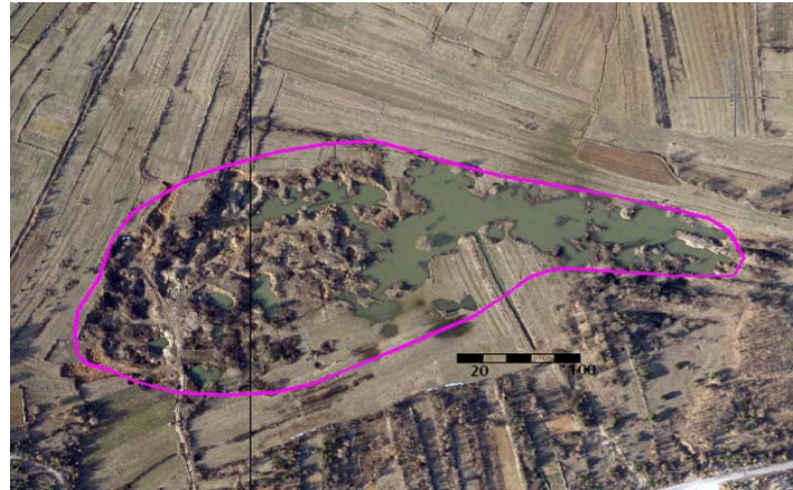
Slika 3. Avionski snimak predmetnog područja s ucrtanim konturama devastiranog terena

krajobraznom smislu nema elemente izrazito devastiranog terena. Međutim, u smislu uporabljivosti i kvalitete zemljišta, predmetne su parcele izgubile status poljoprivrednog zemljišta.