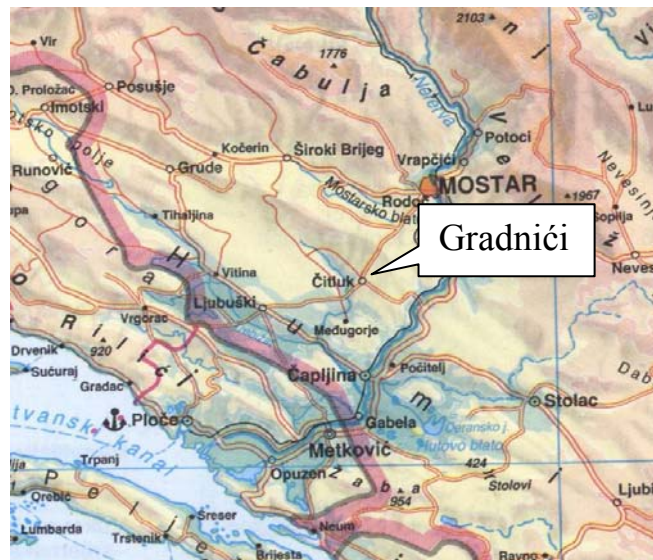
Slika 1. Zemljopisni položaj Gradnića