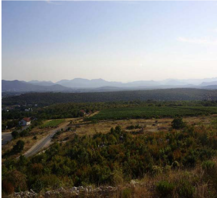
Slika 7. Nasad vinove loze na jalovini

Ova činjenica je važna i u kontekstu rješavanja imovinsko-pravnih odnosa gdje se otvara mogućnost zamjene u povoljnim odnosima za vlasnika (npr. 1:3). Viškom jalovine ili neuporabljivom jalovinom se može zatrpati obližnja boksitna jama na slici.