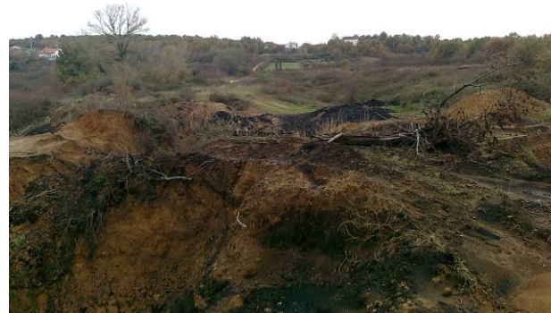
Slike 4. i 5. Detalji terena

Analizom posjedovnih odnosa i namjene površina definiranim u posjedovnim listovima, utvrđeno je da se u smislu namjene korištenja veći dio predmetnih parcela vodi kao neplodno zemljište (75 %), a ostali dio kao pašnjaci i njive.