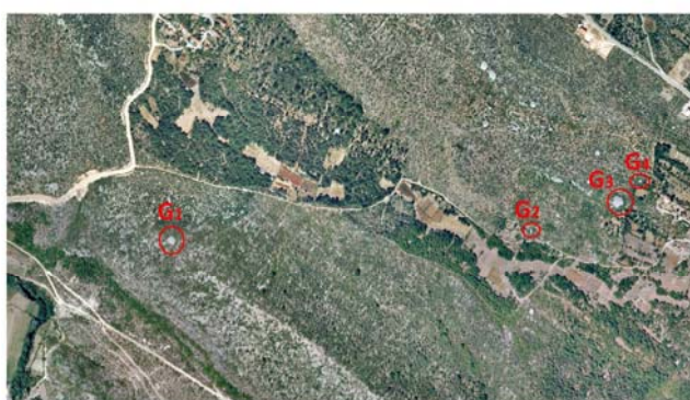
Orto foto snimka