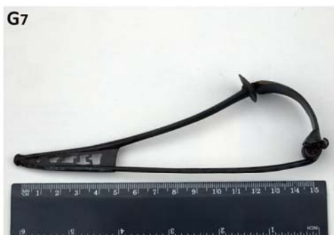
Nalazi u gomilama u Zvirovićima