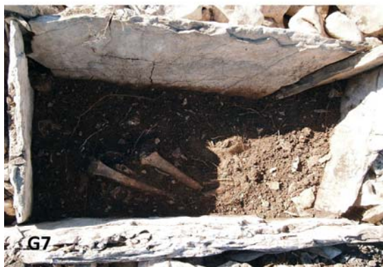
Grobne konstrukcije na čvorištu Zvirovići