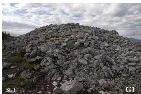
Gomile G1 i G3, Zvirovići