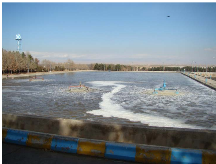
Slika 1. Uređaj za pročišćavanje otpadnih voda Perkandabad

Jedno od najvažnijih komunalnih uređaja za pročišćavanje otpadnih voda u Mashhadu je uređaj za pročišćavanje otpadnih voda Perkandabad br. 1 (slika 1), koje se nalazi na južnoj obali sezonske rijeke. Nazivni kapacitet ovog uređaja za pročišćavanje je 15.200 kubika dnevno, a populacija koju pokriva je 100.000 stanovnika. Proces obrade koji se koristi u ovom postrojenju za pročišćavanje je aerirana laguna s potpunim miješanjem, a nepročišćena otpadna voda se obrađuje puštanjem kroz jedinicu za sakupljanje otpada, aeracijske lagune, taložnik, izvodno jezerce i jedinicu za dezinfekciju. Zbog ispuštanja otpadnih voda iz uređaja za pročišćavanje Perkandabad br. 1 u rijeku u određena doba godine, projekt ovog uređaja za pročišćavanje se temelji na ispuštanju površinskih voda.