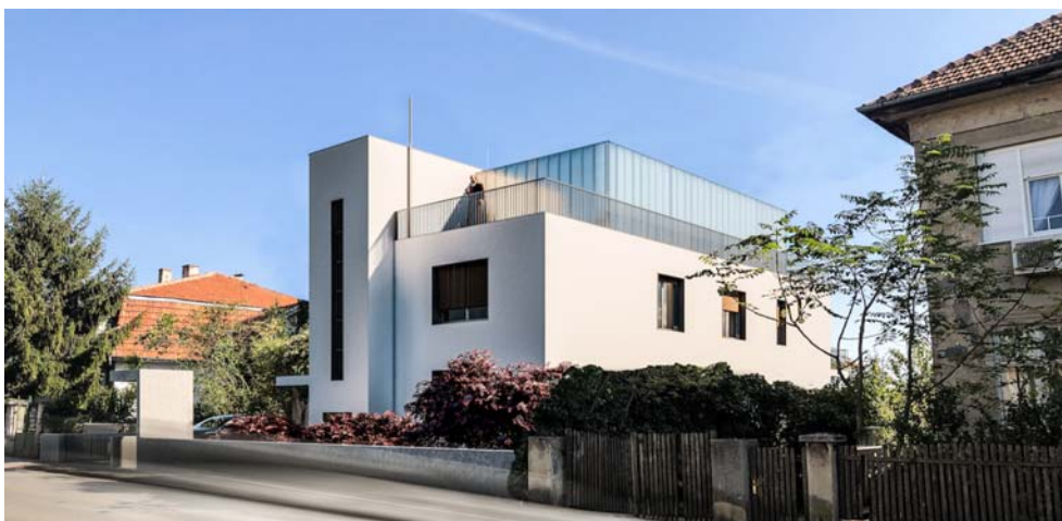
Slika 4. 3D model buduće vile Mosinger, pogled s jugozapada (s ulice Pantovčak), 2022.

Zbog rasporeda i namjene prostorija izmijenjeni su veličina i pozicija otvora na sjevernom i istočnom pročelju; na drugom katu južnog pročelja dodani su manji otvor i prozor kupaonice treće spavaće sobe. Preoblikuje se ograda terase drugog kata. Na mjestu je izvorne ograde Šterkovog neprohodnog ravnog krova, a u nadogradnji iz 1983. bila je to ograda terase drugog kata.