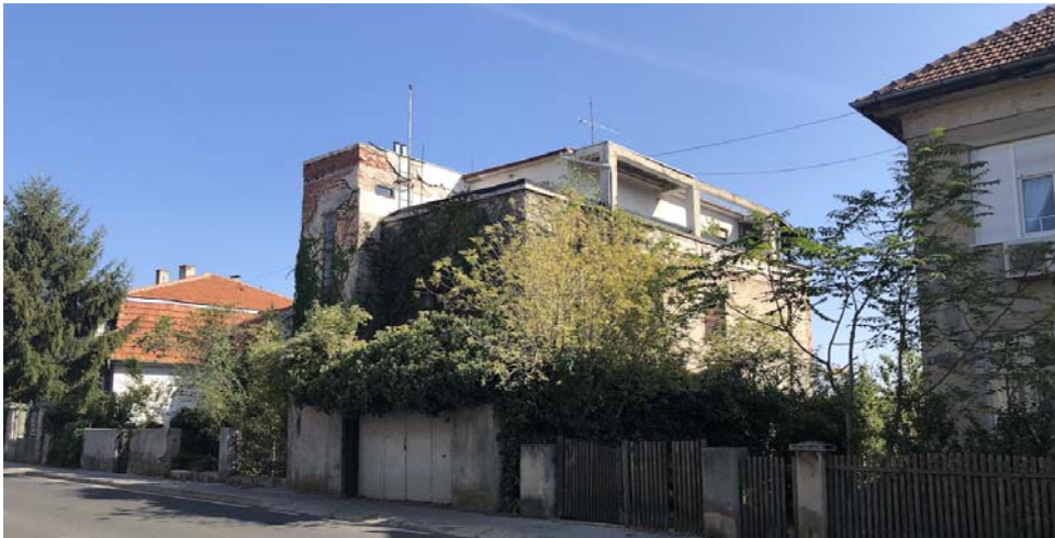
Slika 3. Fotografija postojeće vile Mosinger, pogled s jugozapada (s ulice Pantovčak), 2020.

Budući da nije bilo moguće obnoviti postojeću vilu Mosinger, projektom nove vile, odnosno projektom djelomične replike izvorne Šterkove vile Mosinger i projektom rekonstrukcije dograđenih dijelova drugog kata i garaže, nastojala su se zadržati sva ona obilježja i svi oni elementi koji vili Mosinger pridaju značaj spomenika. Formom, kompozicijom i volumenom (vanjskim gabaritima) djelomična replika je u skladu s izvornom vilom. Obnova zapadnog, uličnog pročelja izvodi se prema Šterkovu projektu iz 1930., a južnoga prema izvedenom stanju 1931. Oba pročelja bit će oličena bojom najstarijeg sloja. Replika se planira za čelični jarbol i čelične ograde na francuskim prozorima blagovaonice na južnom pročelju (koji nisu bili predviđeni u projektu iz 1930. i vjerojatno su izvedeni u sklopu izmjene za vrijeme izgradnje).