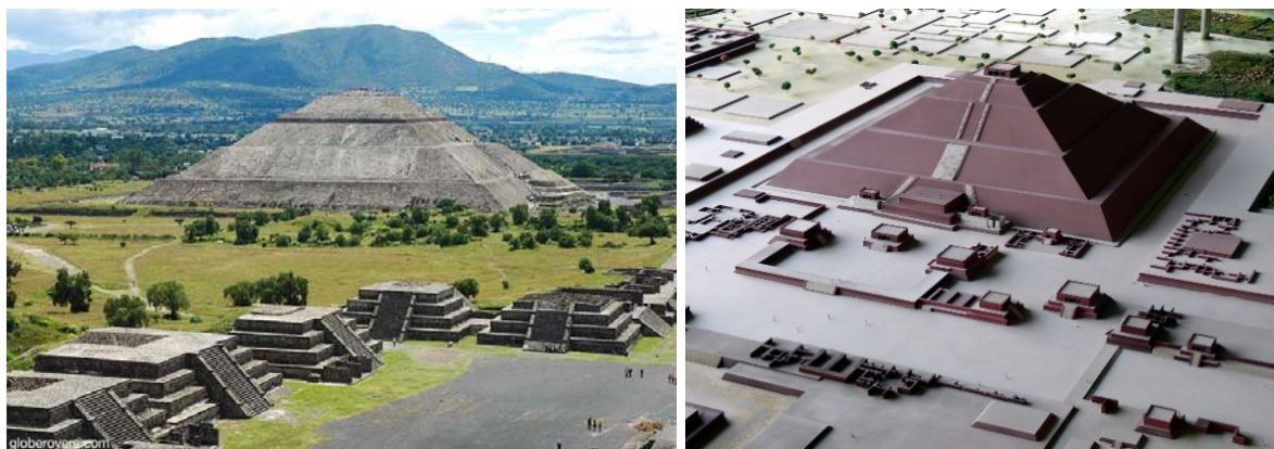
Slike 10.-11. Teotihuacán: Piramida Sunca (lijevo) i njen model (desno); lako ima upola manju visinu od Keopsove („Velike“) piramide, uz približne dimenzije stranica (225 m), broj od preko 2,5 milijuna tona kamenih blokova je iznimno respektabilan; U izgradnji Keopsove piramide je korišten matematički broj “ \pi ”, a u izgradnji Piramide Sunca korijen broja “ \pi ”; [25] Pretpostavlja se da je građena 30 godina, [26]

Piramida Sunca, Piramida Mjeseca i treća, manja, piramida Quetzalcoatl-a (Hram pernate zmije) po površini odgovaraju onima u Gizi, u Egiptu. Oba vrlo udaljena piramidalna kompleksa odgovaraju zvjezdanom pojasu Orion na noćnom nebu, koji se sastoji od dvije zvijezde blizanca i jedne male zvijezde, tzv. "bijelog patuljka", [4].