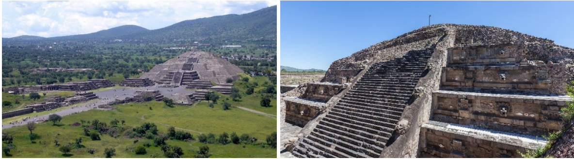
Slike 12.-13. Teotihuacán: Piramida Mjeseca (stranice 145 m), okružena s 15 manjih, nalazi se na sjevernom kraju kilometrima duge, 150 m široke, „Avenije mrtvih“ (lijevo); Ogromnim gradskim trgom dominira hram Quetzalcoatl-a (Pernate zmije), izgrađen u obliku treće, manje stepenaste piramide, čije zidove krase likovi Vatrene zmije (simbol dnevnog prolaza Sunca) i Pernate zmije (božanskog bića Quetzalcoatl-a, simbola jedinstva zraka i kopna, neba i zemlje) (desno), [4], [27], [28]

Grad je doživio nagli kraj polovicom VIII. st. Njegovu padu nesumnjivo su pridonijele navale Chichimeka, barbarskih plemena sa sjevera. Nakon razdoblja ratova i političke rascjepkanosti, oko 950. g. glavni grad je premješten u Tollan, odnosno Tulu (na španjolskom). Drugi val doseljenika (Nonoalca), koji je došao s jugoistoka, bio je visoko civiliziran, donijevši svoj način gradnje velebnih gradova, palača, hramova i piramida. Nazvali su se Toltecima, a riječju „tolteštvo“ (toltecayotl) označavan je skup svih vrlina. Kad je Tula bila na svom vrhuncu (oko 1.100 g.), u njoj je živjelo oko 40.000 ljudi. Živopisne aztečke legende govore o „čudesnom gradu s prekrasnim građevinama, čiji su zidovi bili obloženi zlatom, srebrom, koraljima, školjkama i kecalovim perjem“, od čega su danas ostali tek kameni stupovi i reljefi, [23].