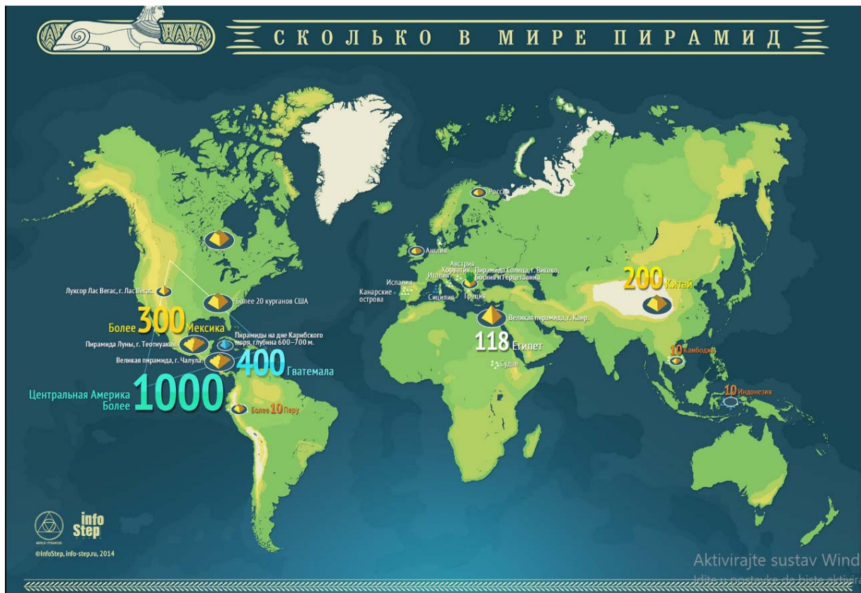
Slika 1. Raspored i procijenjeni broj piramida (drevnih i novijih komercijalnih) u svijetu [2]

Iz Slike 1. vidljiv je raspored suvremenih piramida, koje nisu predmet ovog rada, i drevnih piramida širom svijeta i njihov približan broj: Egipat - 118, današnji Sudan, Središnja Amerika - 1.000 (Meksiko - 300, Gvatemala - 400, Honduras, Salvador i Belize), Peru - 10, Kina - 200, Kambodža - 10, Indonezija – 10, [2].