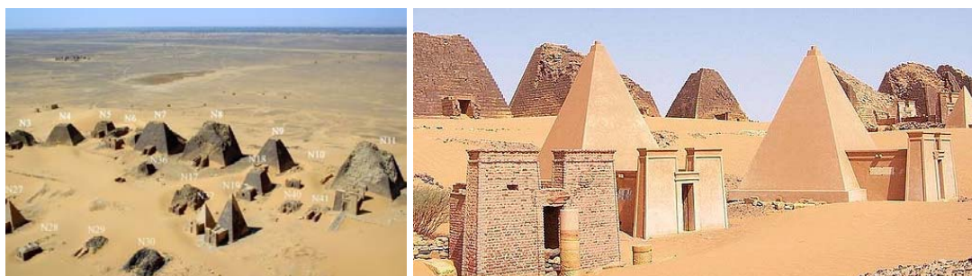
Slike 6.-7. Nubijske piramide u Meroe-u [20], [21]

piramidalnih grobnica, njih između 200 i 255, što je više od egipatskih 138. Dominacija kušitskog kraljevstva sa središtem u Napati u Egiptu bila je relativno kratka, ali je kulturni utjecaj Egipta bio iznimno velik, pa su od VII. st. pr. Kr. etiopski kraljevi i napatski vladari podizali piramide kao svoje grobnice. Za vrijeme posljednjeg sudanskog kraljevstva Meroe (300. g. pr. Kr.-300. g.) izgrađeno je više od 200 kraljevskih piramidalnih grobnica na tri mjesta, koje su služile kao grobnice kraljeva i kraljica Napate i Meroe, [19]. Njihove dimenzije se značajno razlikuju od egipatskih. Građene su od stepenastih slojeva horizontalno postavljenog kamenja, a visina im je od oko 3 do 30 m, dok je prosječna egipatska piramida visoka otprilike 138 m. Stranica osnove rijetko prelazi 8 m, tj. pet puta je manja od egipatskih, tako da su piramide mnogo uže i strmije, sa nagibom od oko 70^{\circ} (kod egipatskih - 40^{\circ} - 50^{\circ} ), [19].