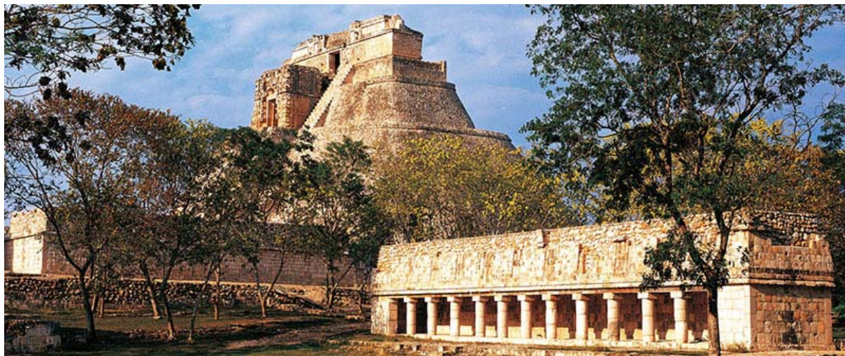
Slika 29. Uxmal: Kompleks zgrada svećenika sa Piramidom Mađioničara, građenom u 5 faza, visine 35 m, sa zaobljenim stranama i strmim stubištem s obje strane - jednom od najljepših na svijetu, [36]; Istočno stubište s 89 stepenica, ima identičan nagib kao Kefrenova piramida u Egiptu, [4]