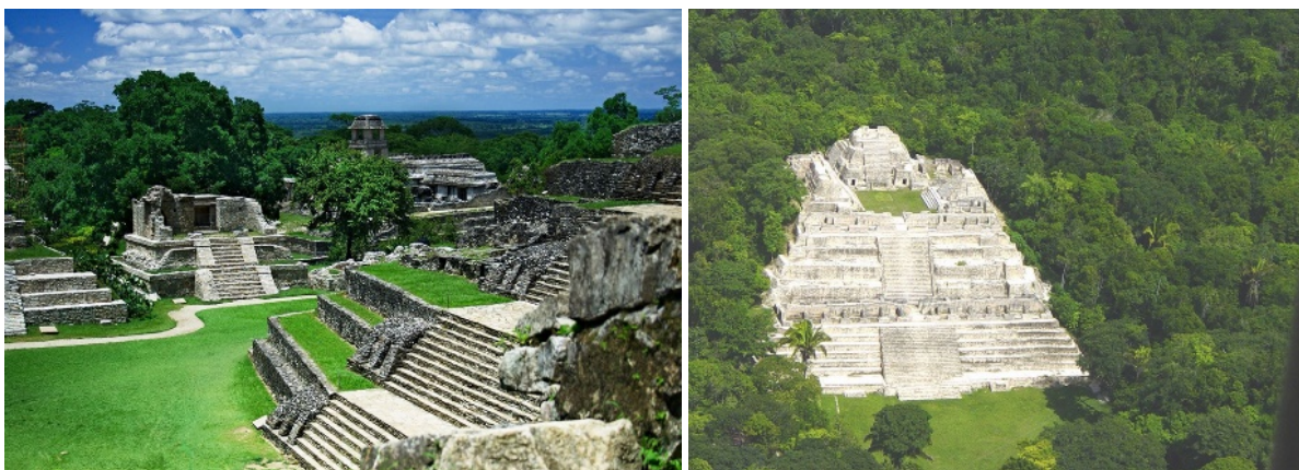
Slike 18.-19. Građevine Maya u Caracolu - Toranj Caana je s 41 m najviša građevina u Belizeu, [32]

Piramidalne strukture Maya pojavljuju se u velikom broju različitih oblika i funkcija, ograničenih regionalnim i periodičnim razlikama na lokalitetima, i to u Meksiku (Chichen Itza Cholula, Coba, Bonampak, Calakmul, Comalcalco, Edzna, El Tigre, Palenque, Uxmal, Yaxchilan,...), Gvatemali (Aguateca, Dos Pilas, El Mirador, La Danta, Kaminaljuyu, Yaxha,...), Hondurasu (Copan) i u Belizeu (Altun Ha, Caracol, Lamanai, Xunantunich,...).