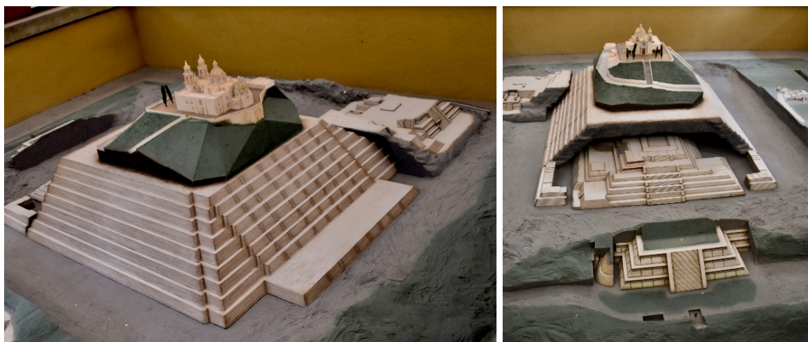
Slike 20.-21. Cholula - model Crkve na vrhu sakrivene, djelomično rekonstruirane Velike piramide Tepenapa, stranice oko 450 m, visine 65 m, najvećeg volumena na svijetu, koja nadmašuje i Keopsovu piramidu i Piramidu Sunca u Teotihuacánu, [33]