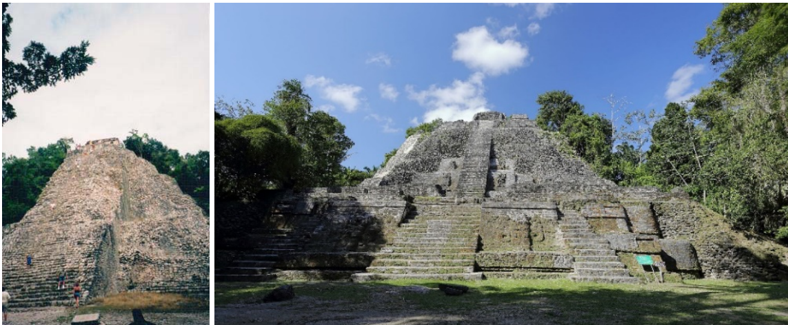
Slike 22.-23. Coba: Velika piramida sa hramom na vrhu, najviša sačuvana piramida meksičke regije Jukatan (lijevo), [4]; Lamanai: Visoki hram, visine 33 m, jedan od 4 velika hrama (desno), [34]