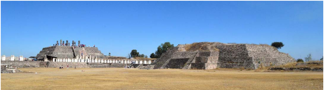
Slika 16. Tula: Piramide C (desni dio slike) i piramida B sa divovskim kamenim stupovima ratnika, koji su nekad nosili krov hrama na vrhu piramide, [30]

Do danas su identificirana tri glavna ceremonijalna središta u Tuli: Mala Tula, Trg Charnay i Akropola, ceremonijalni centar, koji je najimpozantniji. Sastoji se od velikog središnjeg trga na čijoj je istočnoj strani najveća struktura, poznata kao „Piramida C“, koja je samo djelomično iskopana. Na sjevernoj strani leži poznatija „Piramida B“, odnosno Piramida Quetzalcoatl ili Piramida Jutarnje zvijezde. To je peterkatna građevina slična Hramu ratnika u Chichen Itzi, [26].