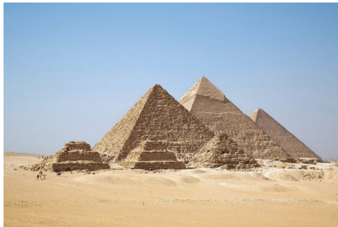
Slika 5. Kompleks piramida u egipatskoj Gizi sa 3 velike i 3 male piramide, [11]

Fascinantno je kako piramide u Gizi i dalje postoje, strukturalno jednake, poslije četiri i pol tisućljeća. Čak i kada ih je u XII. st. kurdski vladar Al-Aziz pokušao uništiti, nije uspio, pa je odustao, oštetiivši sjeverno lice Mikerinove piramide.