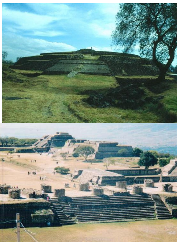
Slike 30.-31. Kružna piramida Kvikvilko, za koju arheolozi tvrde da je najstarija kamena struktura u Srednjoj Americi i prvi monument u obje Amerike, izgrađena u dobu ne starijem od 600. g. pr. Kr. (lijevo); Oaxaca: Monte Alban (španjolski: „Bijela planina“), službeno drugi po veličini „ceremonijalni“ centar na Meksičkom tlu nakon Teotihuacána (desno). Ovaj građevinski kompleks smješten je na planinskom vrhu koji je poravnat do savršenstva (22,3 ha), slično kao plato za piramide u Gizi, [4]