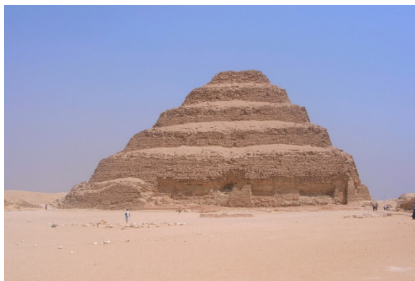
Slika 2. Djoserova stepenasta piramida, najstarija piramida u Egiptu (oko 2.610. g. pr. Kr.) [6]

Smatra se da je egipatski pretpovijesni običaj gradnje simbolične kuće na podzemnom grobu prvo poprimio oblik mastabe, izdužene građevine s ravnim ili plitko zasvođenim krovom, te kasnije stepenaste piramide, kao niza četvrtastih mastaba, stepenasto jedna iznad druge, čime je stvorena građevina u vidu stubišta sa stepenicama prema vrhu koje prave put faraonovoj duši ka nebu. Najpoznatija i najveća od 8 stepenastih piramida je Djoserova (2.630.-2.611. pr. Kr.) piramida u Saqqari, najvećem groblju grada Memfisa. Po svom izgledu podsjeća na građevine Babilona i Središnje Amerike. Prema nekim istraživačima, zablude egiptologa se odnose na vrijeme njene gradnje, a druga moguća zabluda se odnosi na namjenu piramida kao grobnica, jer ne samo da je "grobna komora" premala za ljudsko tijelo, već ni ova, niti jedna druga stepenasta piramida diljem Egipta nema grobnu komoru, niti je u njima pronađen sarkofag ili mumificirana tijela, [4].