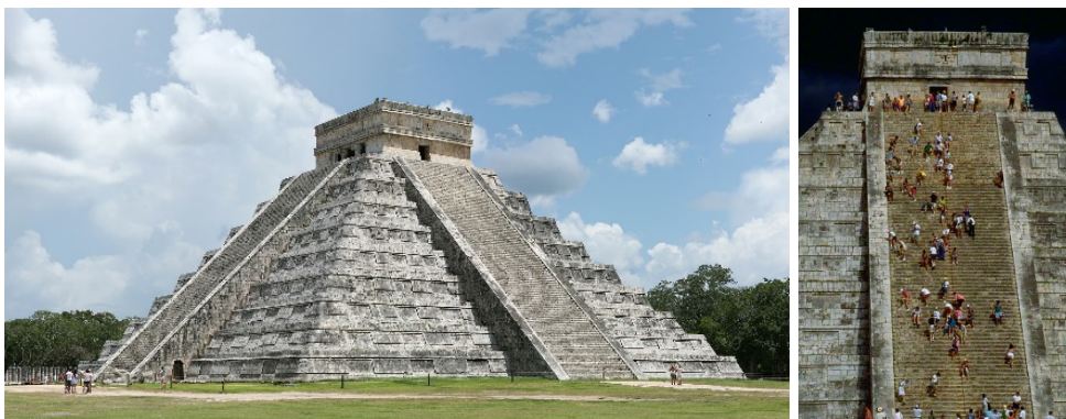
Slike 14.-15. Chichen Itzá: Piramida El Castillo (dvorac) ili Kukulkanova piramida, visine 30 m, uključujući i hram na vrhu, izabrana u 7 novih svjetskih čuda; Savršeno simetrična građevina sadrži elemente sofisticiranog kalendara Maya, vezano za broj stepenica, terasa i panela [4], [29]

Brzim osvajanjem izgradili su carstvo i zavladao cijelom Središnjom Amerikom. Pojavili su se novi gradovi, kulturna žarišta: Coatlinchan, Texcoco i Coyoacan. Godine 1.000. g. prodrli su i na Yucatan i osvojili gradove u kojima je još cvala kasna civilizacija Maya, među njima grad Chichén Itzá, snažno utječući na Maye. Tolteci su stvorili nov, prepoznatljiv „mješoviti“ mayansko-toltečki stil. Chichen Itzá je grad Maya, ali mnogi znakovi govore da su njime vladali Tolteci, [23].