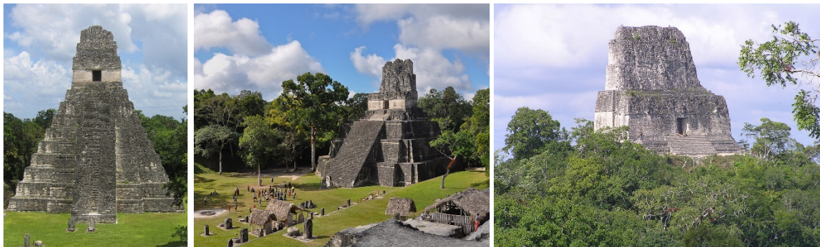
Slike 26.-28. Tikal, „glavni grad Maya“, nekada najveći grad Maja, blistao s veličanstvenim zgradama, jezerima i kamenim mostovima; Građevine broj I - Hram velikog Jaguara (lijevo), Građevina broj II (sredina) i Građevina broj IV (desno), visine 96 m i vjerojatno 15-tak m ispod površine - „najviša građevina koju je sagradila indijanska ruka u Americi“, [4],[36]