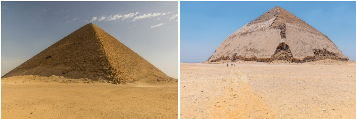
Slike 3.-4. Prve dvije „prave“ piramide: Crvena (Sjeverna) i Zakrivljena (Savijena) piramida [7]

uspjeha. Prva dva uspješna pokušaja izgradnje prave piramide na svijetu su bile piramide faraona Snofrua (oko 2.550. pr. Kr.). Crvena (Sjeverna) piramida, najveća je od 3 piramide u Kraljevskoj nekropoli u Dahšuru, ujedno najveća piramida u Egiptu do izgradnje piramida u Gizi (volumena 1,69 milijuna m 3 , osnove 220 m i visine 104 m), i Zakrivljena (Savijena) piramida, zvaničnog imena „Južna blistava piramida“ (volumena 1,237 milijuna m 3 , osnove 188,6 m i visine 101,1 m), koja se uzdiže iz pustinje pod strmim kutom od 55 0 , koji se iznenada mijenja u plići kut od 43 0 , [7]. Ni u ovim piramidama ne postoje indicije da je faraon u njima sahranjen, iako su pronađeni ljudski ostaci u Crvenoj piramidi, kao i u Djoserovoj, ali to ne dokazuje da su piramide originalno građene kao grobnice, [4]!