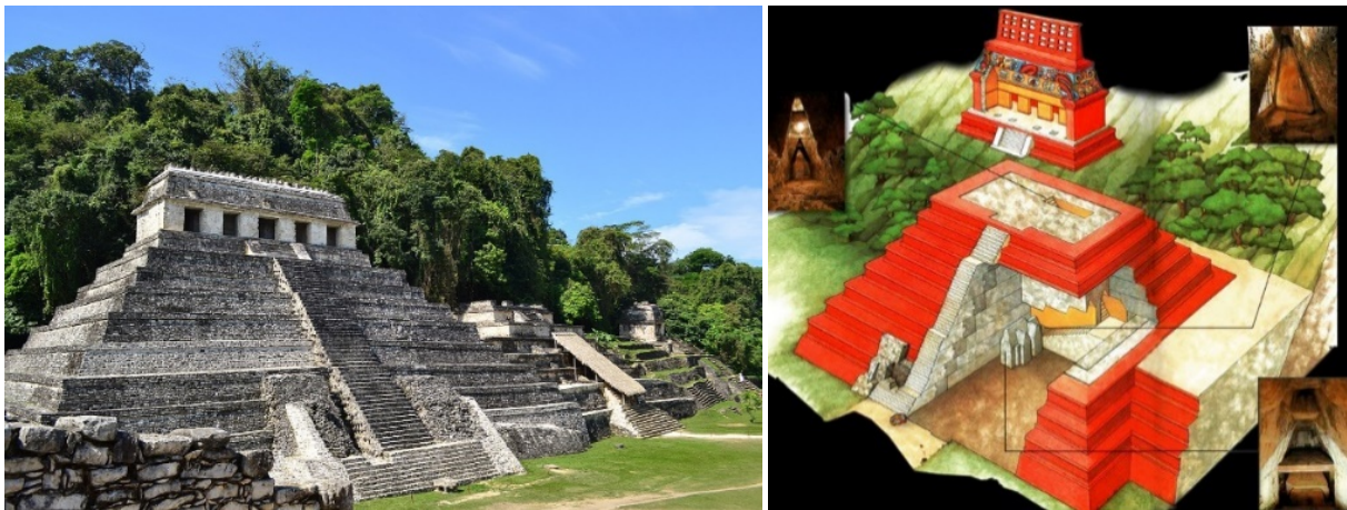
Slike 24.-25. Palenque nosi epitete: „jedan od najvećih gradova Maja”, „najimpresivnije ruševine Meksika”, „najpopularniji arheološki park”, [4]; Stepenasta piramida, s 9 stepenastih razina i Hramom natpisa, predstavlja unikatnu građevinu u svijetu Maja (lijevo), [35]; Duboko u unutrašnjosti sakrivena je tajanstvena kript s masivnim kamenim Pakalovim sarkofagom, mase 50 t (desno), [36]