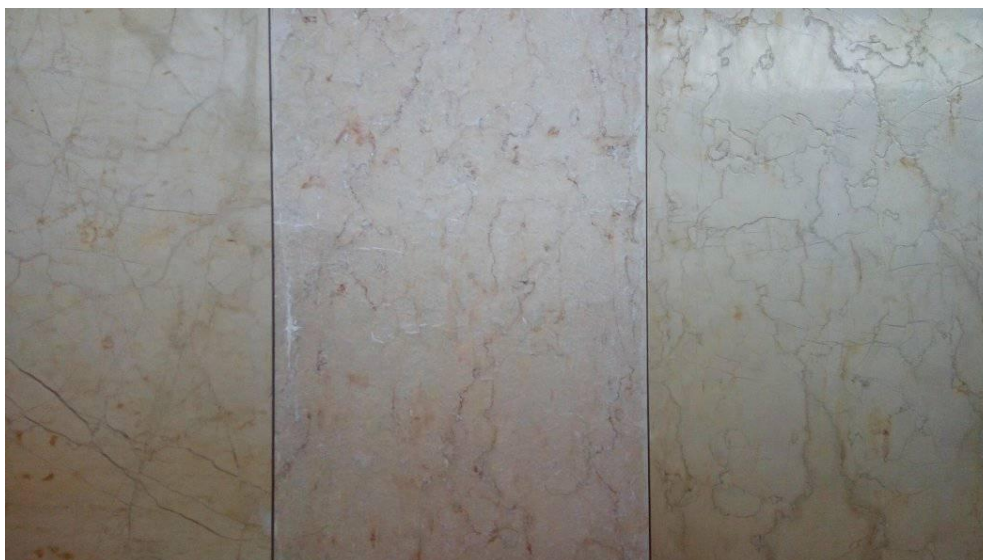
Slika 3. Završna obrada ploča od Silit light kamena, s lijeva na desno: poliran, paljen, antikato (Silit d.o.o. Livno)

U Bosni i Hercegovini, zemljama okruženja i šire ovaj kamen je poznatiji pod komercijalnim nazivom Silit light . Firma Silit d.o.o. Livno koja se bavi eksploatacijom ovog kamena ima i vlastito postrojenje za obradu kamena, gdje vrši rezanje blokova u ploče različite debljine, zatim formatiranje ploča i ostalih elemenata od kamena te finalnu obradu koja se sastoji u poliranju, štokovanju, paljenju i drugim suvremenim načinima obrade površina kamena (Slika 3.). U tablicama 1. i 2. prikazana su fizičko-mehanička svojstva, mineralni sastav i područje primjene krečnjaka sa ležišta „Pogledala“.