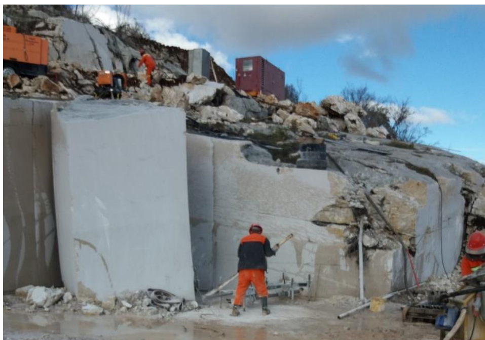
Slika 6. Radovi na otvaranju probno-eksploatacijskih etaža na kamenolomu „Kik 2“ (Kik stone d.o.o. Livno)

Na jugoistočnim padinama planine Dinare u gornjokrednim rudistnim krečnjacima nalazi se ležište arhitektonsko-građevinskog kamena „Kik 2“. Smješteno je na jugozapadnim obroncima brda Kik koji se spuštaju prema planinskom sedlu Vaganj. Na ovom terenu je tvrtka „Kik stone d.o.o. Livno“ vršila istraživanja na dva lokaliteta. Prvi lokalitet udaljen je oko 200 metara od asfaltne putne komunikacije koja vodi prema gradu Sinju u Republici Hrvatskoj. Istražni prostor je dobio naziv „Kik“. Ubrzo poslije isto privredno društvo je oko 200 metara sjevernije započelo istraživanja na istražnom prostoru „Kik 2“ čija je površina 4,73 hektara. Geološka istraživanja su pokazala da su stijenske mase na ovom lokalitetu manje raspucale i kvalitetnije nego na prethodnom lokalitetu. Donesena je odluka da se na lokalitetu „Kik 2“ elaboriraju rezerve arhitektonsko-građevinskog kamena i uradi probna eksploatacija dozvoljenih količina kamena (slika 6.).