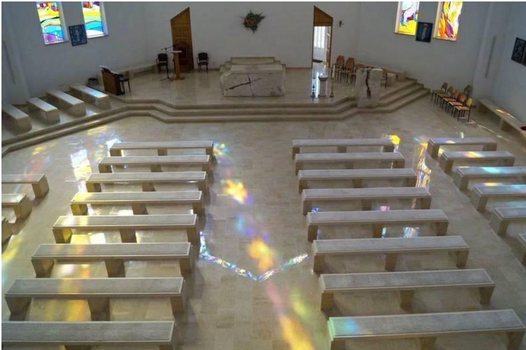
Slika 4. Interijer crkve Gospe od Anđela u Livnu urađen od kamena Silit light (Silit d.o.o. Livno)

light ugrađen je na brojnim stambenim i poslovnim objektima u Njemačkoj, Italiji, Velikoj Britaniji i Sloveniji. Danas se vrši izvoz ovog kamena u Hrvatsku, Sloveniju, Italiju, a zahvaljujući kvaliteti pronašao je svoje mjesto i na dalekom kineskom tržištu.