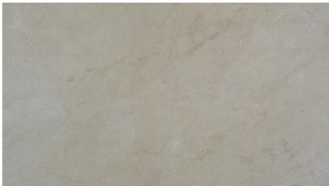
Slika 7. Polirani uzorak krečnjaka sa ležišta „Kik 2“ (Kik stone d.o.o. Livno)

Boja krečnjaka s ležišta „Kik 2“ je svjetlosiva, rjeđe sivosmečkasta do oker, a mjestimično se javljaju nijanse tamnije boje (slika 7.). Kamen je masivno homogene teksture. Na rezanoj površini kamena uočavaju se nepravilne forme milimetarskih veličina koje su svjetlije boje od osnove. Mjestimično se javljaju ravne pukotine širine 1 do 2 mm od kojih je većina zapunjena svjetlijom kalcitnom ispunom. Javljaju se i one čija je kalcitna ispunja tamnije boje. Mogu se vidjeti i stilolitski šavovi, a kamen je nepravilnog loma.