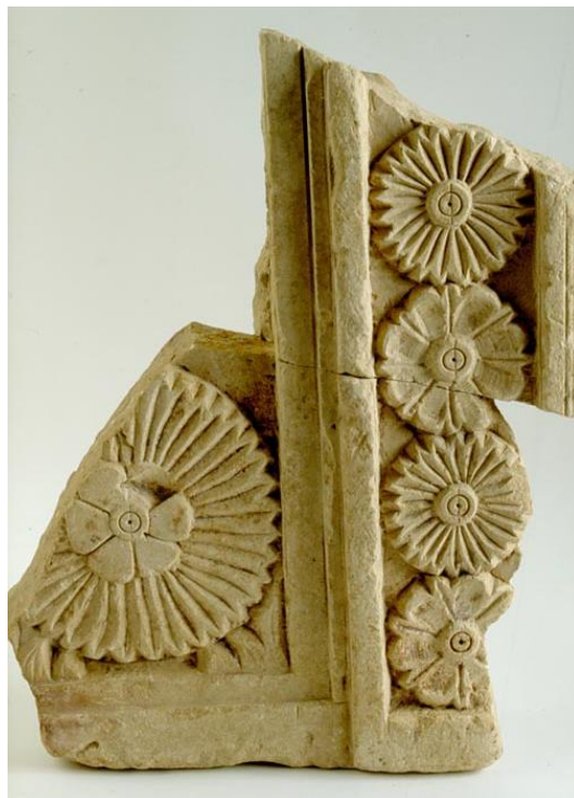
Slika 2. Ulomak pluteja (oltarne pregrade) iz bazilike na Rešetarici, (V-VI vijek) urađen od miocenskog slatkovodnog krečnjaka (vjerovatno iz kamenoloma na brdu Bužanin) (Franjevački muzej i galerija Gorica Livno, 2008.)

O upotrebi kamena za gradnju u ranom srednjem vijeku svjedoče ostaci ranokršćanskih bazilika kao što je ona čiji su temelji pronađeni na groblju Rapovine u Livnu ili ona čiji su ostatci pronađeni u Rešetarici južno od Livna. U njihovoj gradnji su korišteni krečnjaci mezozojske starosti kao i miocenski slatkovodni krečnjaci koji su u ovom kraju poznati pod nazivom muljika. U bazilici iz Rešetarice od muljike je rađen i crkveni namještaj (slika 1.). Pri gradnji bazilike u Rešetarici korištena je i sedra.