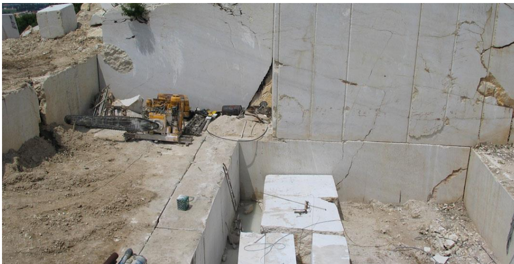
Slika 2. Dio kamenoloma Pogledala (Silit d.o.o. Livno)

U Bosni i Hercegovini, zemljama okruženja i šire ovaj kamen je poznatiji pod komercijalnim nazivom Silit light . Firma Silit d.o.o. Livno koja se bavi eksploatacijom ovog kamena ima i vlastito postrojenje za obradu kamena, gdje vrši rezanje blokova u ploče različite debljine, zatim formatiranje ploča i ostalih elemenata od kamena te finalnu obradu koja se sastoji u poliranju, štokovanju, paljenju i drugim suvremenim načinima obrade površina kamena (Slika 3.). U tablicama 1. i 2. prikazana su fizičko-mehanička svojstva, mineralni sastav i područje primjene krečnjaka sa ležišta „Pogledala“.